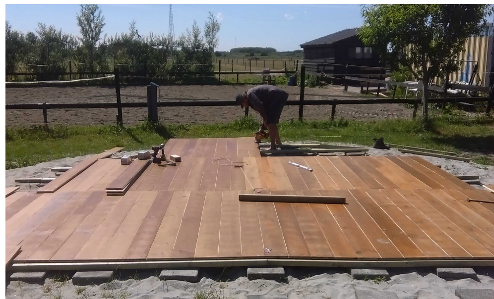
Pavimento standard con mattonelle