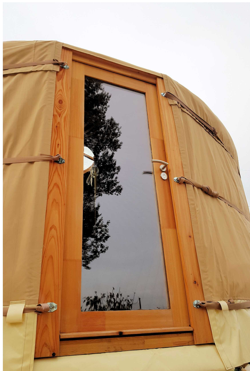
Porta singola standard