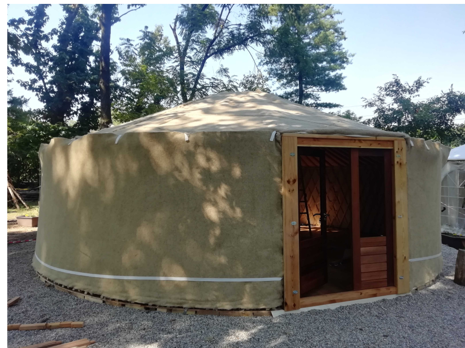
Isolamento in canapa (standard)