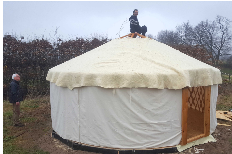
Isolamento in lana di pecora (su richiesta)