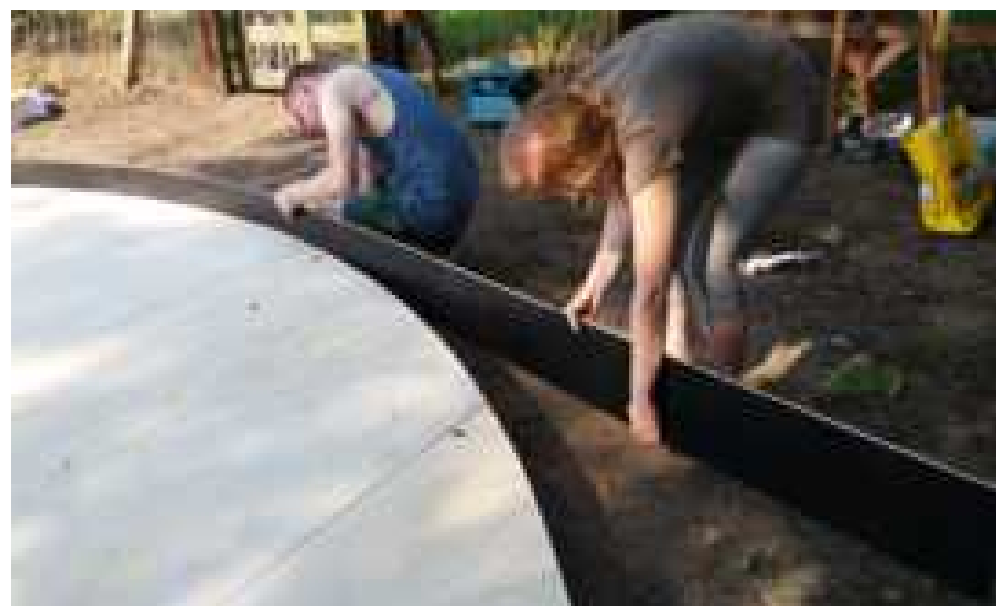
Pavimento con isolamento