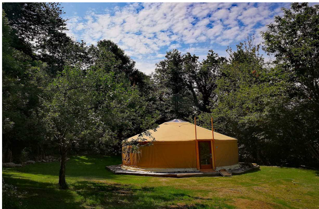
Colore tessuto esterno beige